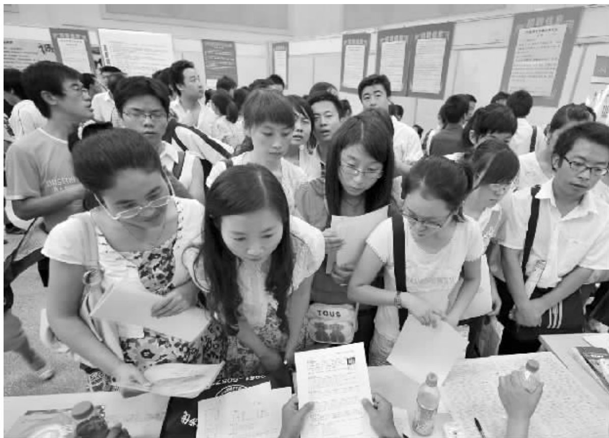
人力资源和社会保障部表示,我国将继续通过实施扩大内需的一系列政策来扩大就业机会。图为宁夏2009夏季综合性人才交流会日前在银川举行,130多家单位提供2400多个就业岗位,吸引了近万名求职者冒着高温前来求职。

第三,需要完善的就是在转移之后,必须保证参保人在最后领取待遇的时候,能够把他各地就业积累的养老保险权益累计计算。